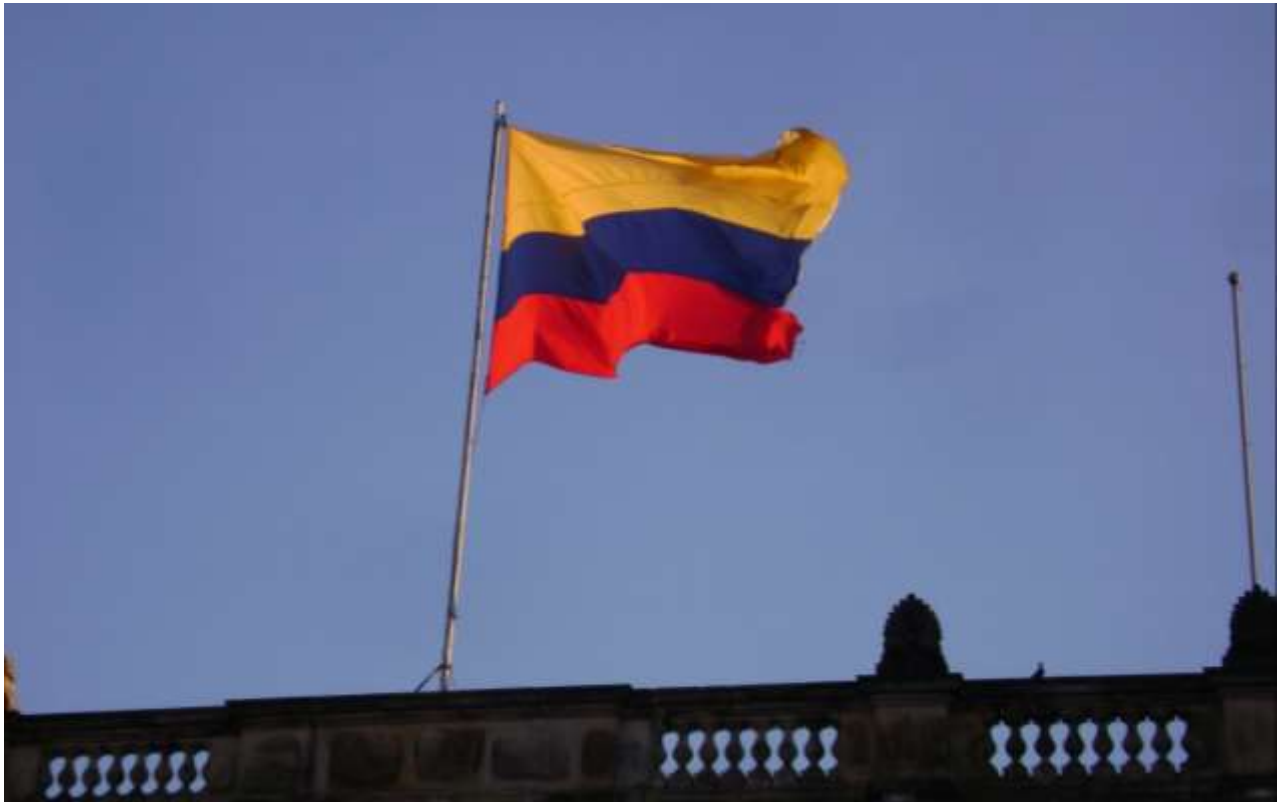
Bandera de Colombia sobre el Capitolio Nacional en Bogotá, Foto de la autora: 2018

Se terminó siendo las 6:26 p.m. del día 7 de noviembre Y contiene 39 páginas.